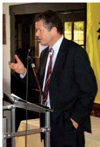
Frank Vanhecke blikte terug op 30 jaar Vlaams Blok/Vlaams Belang.